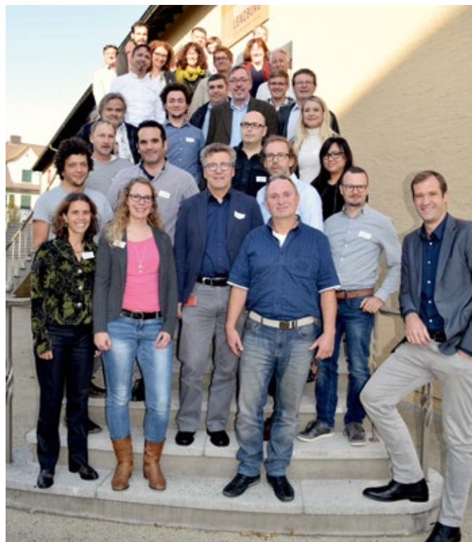
Nouvellement créée : communauté d'intérêts Transformation et Commercialisation Demeter (IG V & H)

L'année 2018 a été marquée par la planification et la mise en œuvre de nos nouvelles structures. Fin octobre, nous avons